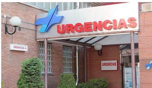
Entrada a Urgencias

Enfermeros y TCAE cuentan a Redacción Médica las mejores horas y los días más interesantes para hacer turno