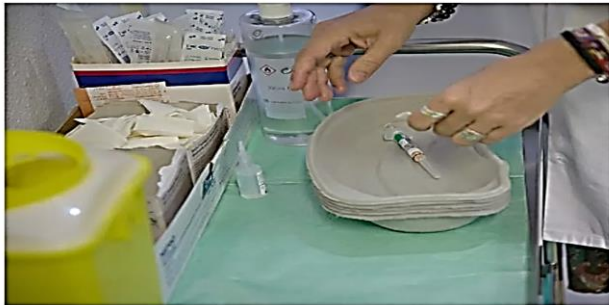
Una enfermera prepara una vacuna.

El objetivo es aliviar los síntomas y erradicar la infección de manera rápida y eficaz, maximizando la accesibilidad al sistema sanitario