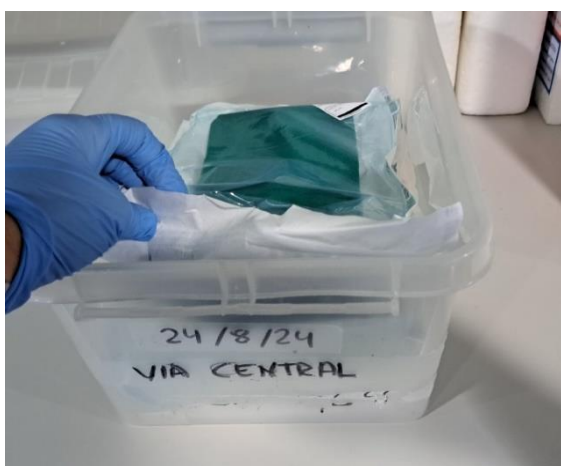
Img. 1 Set Via central.

Tras la comunicación previa de la llegada de un paciente crítico, debemos conocer la patología y el tiempo estimado para su llegada, lo que nos permitirá preparar el material necesario como pueden ser los sets que contienen los elementos imprescindibles para realizar diversas técnicas que deben aplicarse de forma urgente, tales como la colocación de una Vía Central, un set de Pericardiocentesis, Sondaje Vesical entre otros. Estos sets ya listos, son montados y revisados por el TCE de Urgencias en cada turno. (Imagen 1)