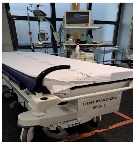
Img. 2 Box de código ICTUS

En esta área también es donde se lleva a cabo la atención del “Código Ictus”, en el que el tiempo es un indicador de prevención de complicaciones y secuelas, y por tanto la asistencia es inmediata y en el cual las/los TCE desempeña sus funciones como parte del equipo sanitario. Dentro de las tareas asignadas, debemos hacer la toma de la tensión arterial de ambos brazos, dado que es un factor de riesgo en estos casos, y el registro en su historia clínica, permite al médico tomar las decisiones terapéuticas oportunas. Las/los TCE, siempre deben estar alerta para los requerimientos de la enfermería y la medicina con relación a las pruebas diagnósticas y tratamiento para prestar apoyo en todo lo que sea necesario. (Imagen 2)