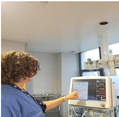
Img. 5 Control del funcionamiento del aparataje clínico

Todas estas actividades que forman parte de las funciones asignadas a las/los TCEs, pueden parecer carentes de importancia; sin embargo, son la base del trabajo de los otros miembros del equipo y hacerlo correctamente contribuye a la calidad asistencial del servicio y a la seguridad de los pacientes.